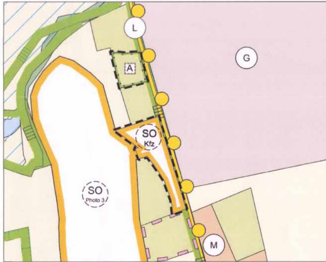
wirksamer FNP der Stadt Eilenburg vom September 2009 (Ausschnitt)